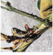
গামোসিস আক্রান্ত শাখা

রোগ প্রতিরোধী রুটস্টক ব্যবহার করা এবং বর্ষার আগে ও পরে কাণ্ডে বর্দেপেষ্টের প্রলেপ দেয়া। গাছের গোড়ার মাটিতে মেটালাক্সিলন+মোনোকোজেব (রিডোমিল গোল্ড এম জেড ৭২ ডব্লিউপি) দিয়ে মাটি শোধন করা।