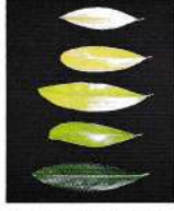
নাইট্রোজেনের অভাব জনিত হলুদ পাতা

বয়সভেদে গাছ প্রতি ২০০-৬০০ গ্রাম ইউরিয়া প্রয়োগ করতে হবে। এপ্রিল ও সেপ্টেম্বর মাসে ১৫ দিন অন্তর ২-৩ বার পাতায় ০.৫% ইউরিয়া সারের দ্রবণ (৫-১০ গ্রাম ইউরিয়া প্রতি লিটার পানিতে মিশাতে হবে) স্প্রে করেও নাইট্রোজেনের অভাব পূরণ করা যায়।