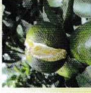
বোরন এর অভাব জনিত হলুদ পাতা

বোরনের ঘাটতি মোকাবেলার জন্য মাটিতে জৈব পদার্থ প্রয়োগ এবং গাছ প্রতি ৫-১০ গ্রাম বোরিক এসিড প্রয়োগ করতে হবে। ১৫ দিন অন্তর ২-৩ বার ০.১% বোরাক্স দ্রবণ (১০ গ্রাম বোরাক্স ১০ লিটার পানিতে মিশাতে হবে) স্প্রে করেও বোরনের অভাব পূরণ করা যায়।