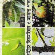
সাইট্রাস লিকমাইনর ও আক্রান্ত পাতা

ক্যান্ডার আক্রান্ত ডাল ছাঁটাই করতে হবে ও কঁচি পাতায় যে কোন প্রবাহমান কীটনাশক (থায়োমেক্সাম/ ইমিডাক্লোপ্রিড গ্রুপ) অনুমোদিত মাত্রায় ১০-১৫ দিন পরপর ৩-৪ বার গাছে স্প্রে করতে হবে। বর্ষা মৌসুমের শুরু থেকে শেষ পর্যন্ত বোদুমিগ্রাণ অথবা কপার অক্সিজোরাইড অনুমোদিত মাত্রায় ১০দিন পরপর অথবা কৃষি বিশেষজ্ঞের পরামর্শমত গাছে স্প্রে করতে হবে।