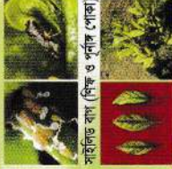
সাইলিড বাগ (শিক ও পূর্ণিত পোক)

গ্রীনিং মুক্ত মাতৃগাছ থেকে সায়ন সংগ্রহ করতে হবে ও রোগমুক্ত চারা রোপন করতে হবে। আক্রান্ত গাছ উঠিয়ে পুড়িয়ে ফেলতে হবে। কঁচি পাতায় যে কোন প্রবাহমান কীটনাশক (থায়োমেক্সাম/ইমিডাক্লোপ্রিড গ্রুপ) অনুমোদিত মাত্রায় ১০-১৫ দিন পরপর ৩-৪ বার অথবা কৃষি বিশেষজ্ঞের পরামর্শমত গাছে স্প্রে করা।