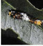
লেবুর হজগতি আক্রান্ত পাতা

যে কোন স্পর্শ ও পাকস্থলী বিক্রিয়া সম্পন্ন কীটনাশক (ক্লোরোপাইরিফস/ সাইপারমেথ্রিন/ ল্যামডা-সাইহেলোগ্রাট্রিন গ্রুপ) অনুমোদিত মাত্রায় ১০-১৫ দিন পর পর ২-৩ বার অথবা কৃষি বিশেষজ্ঞের পরামর্শমত গাছে স্প্রে করতে হবে।