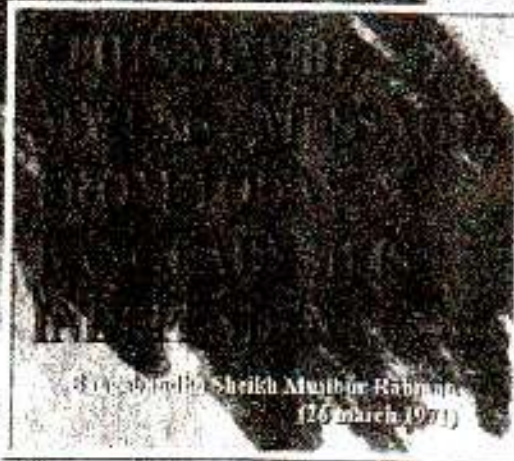
শেখ মুজিবুর রহমান 126 March 1971